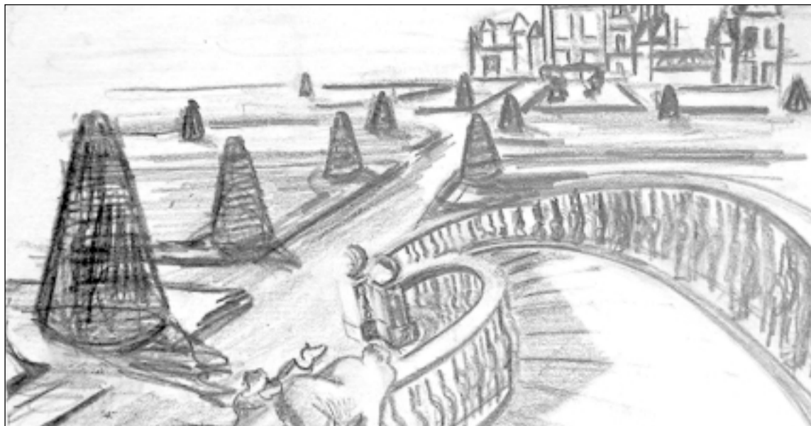
Uno de los bocetos a lápiz expuestos. S.E.