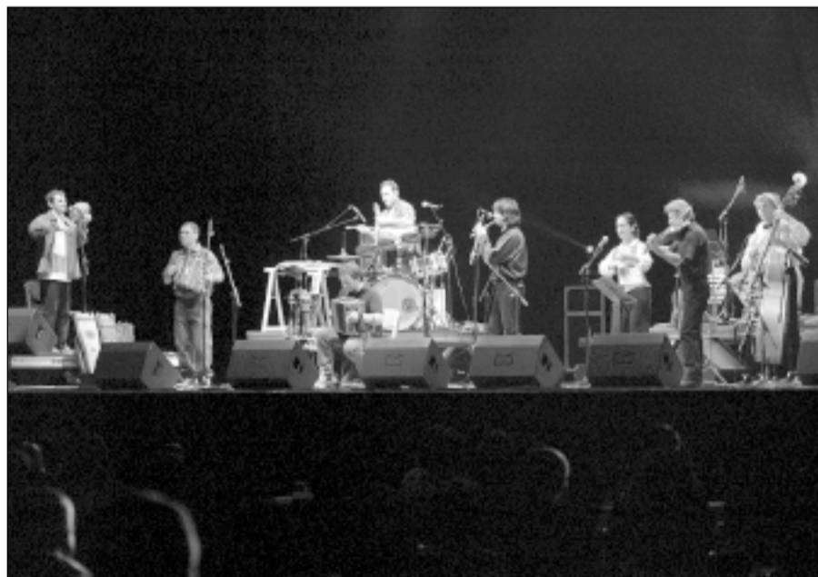
Imagen de Biella Nuei en un concierto anterior.